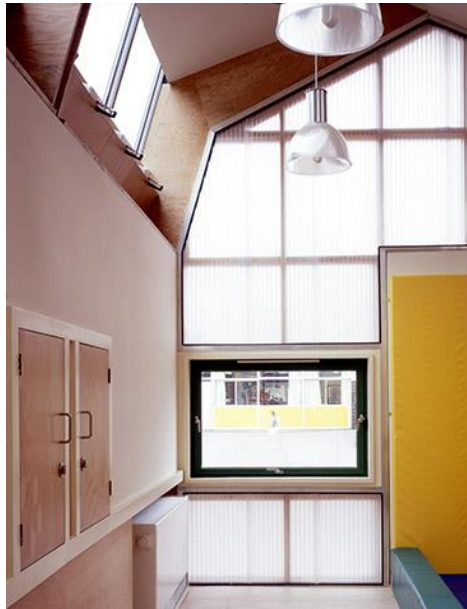
تصویر ۱. استفاده از شیشه سندبلاست (۱۵)