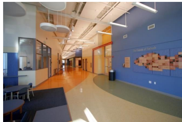
تصویر ۲. استفاده از تغییر رنگ در کف به منظور جهت‌یابی در مرکز اوتیسم (۱۶)