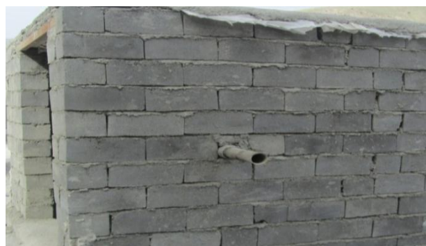
شکل ۵: اتاقک رسوب دهنده و محل ورود گرد و غبار

شکل ۴: لوله های ۴ اینچی ورود سیمان و خروج گرد و غبار به اتاقک رسوب دهنده