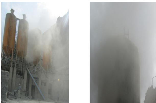
شکل ۱: محیط بچینگ ها به هنگام شارژ سیمان و تولید بتن قبل از اجرای روش کنترل

می‌شد. به همین دلیل برای کاهش فشار وارده دو سیلوی سیمان با لوله‌های ۸ اینچ به هم متصل گردیدند. لازم به ذکر است بیشتر فشار وارده به سیلوهای سیمان توسط لوله ۴ اینچ خروجی گرد و غبار گرفته می‌شود (شکل ۲).