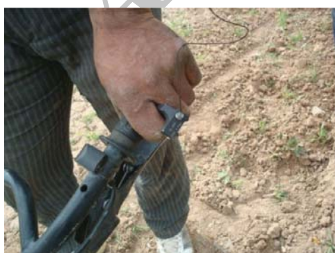
شکل ۵: نصب مبدل UA 0894 جهت اندازه‌گیری ارتعاش در جهات X، Y و Z

ارتعاش مطابق با ISO 5349-1 باید روی یا نزدیک سطح دست‌ها، جایی که ارتعاش به بدن وارد می‌شود اندازه‌گیری گردد. در این مطالعه اندازه‌گیری با استفاده از آداپتورهای مدل UA 0894 و UA0891 شرکت BSK انجام شد. جهت آنالیز داده‌ها از نرم افزار Spss و Ex-cel استفاده شد. اطلاعات مربوط به اندازه‌گیری ارتعاش در جهات مختلف z، y، x و میزان ارتعاش کلی (total) حاصل از اندازه‌گیری در مراحل مختلف دنده خلاص (درجا)، انتقال و شخم زدن زمین با آزمون کلموگروف-اسمیرونوف (K-S) از نظر نرمال بودن مورد ارزیابی قرار گرفت. تنها متغیر total از توزیع نرمال پیروی نمود و دیگر متغیرها (y، x و z) از توزیع نرمال پیروی نکردند