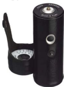
شکل ۳: کالیبراتور شتاب سنج مدل ۴۲۹۴

بر اساس توصیه‌های استاندارد ISO 5349-1 و ISO 5349-2 (ISO 5349-1, 2001, ISO 5349-2, 2001) مهم‌ترین کمیت جهت توصیف مقدار انرژی منتقل شده به دست و بازوی کشاورز RMS (ریشه دوم مربع میانگین شتاب) بر حسب 2 \text{ m/s}^2 می‌باشد. ارزیابی کامل مواجهه با ارتعاش مستلزم اندازه گیری شتاب در جهت‌های تعیین شده، فرکانس‌ها و مدت مواجهه است. بر طبق استاندارد ISO سه جهت متعامد سیستم مختصاتی که در آن میزان شتاب ارتعاش باید اندازه گیری شود عبارتند از: جهت Z در امتداد استخوان‌های متاکارپ دست، جهت X عمود بر جهت Z و جهت Y به موازات