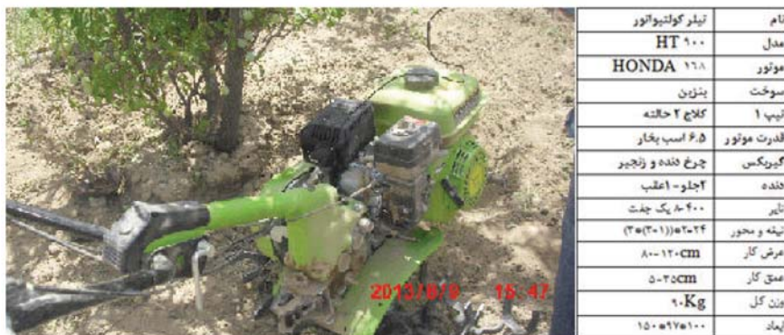
شکل ۱: مشخصات تیلر HT900

این مطالعه یک مطالعه توصیفی - تحلیلی مقطعی است که بر روی ۴۰ نفر از کاربران دستگاه تیلر مدل HT900 در جامعه کشاورزان شهرستان کاشمر که بیش از یک سال سابقه کار با دستگاه را داشتند انجام شد. تصویر و مشخصات تیلر مورد بررسی در شکل زیر نشان داده شده است. تعداد نمونه با استفاده از فرمول مربوط به اندازه گیری نمونه در جوامع نامحدود به دست آمد. پس از تعیین تعداد نمونه، از طریق نمونه برداری ساده تصادفی نمونه‌ها انتخاب شدند و اندازه گیری میزان ارتعاش در ۳ حالت کاری مختلف زیر صورت گرفت: ۱. حالتی که تیلر درجا کار می‌کرد ۲. حالتی که تیلر به زمین کشاورزی انتقال داده می‌شد