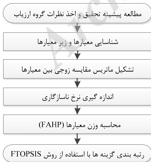
شکل ۱. چارچوب روش پیشنهادی

با توجه به افزایش و رشد پروژه‌های بلندمرتبه‌سازی و خطرات ویژه این نوع ساخت‌وسازها، ارزیابی فرهنگ ایمنی در کارگاه‌های بلندمرتبه‌سازی از اهمیت و ضرورت به‌سزایی برخوردار است. بنابراین کارگاه مورد مطالعه، یک برج اداری-تجاری ۳۳ طبقه فولادی است که در مرحله اجرای اسکلت فلزی و سفت‌کاری قرار داشته و بخشی از یک مگا پروژه تجاری-اقامتی و اداری با زیربنای کل حدود ۶۰۰،۰۰۰ مترمربع محسوب می‌شود. در شکل ۱ جزئیات روش پیشنهادی رتبه‌بندی مشاغل در کارگاه‌های بلندمرتبه‌سازی از نظر فرهنگ ایمنی با استفاده از مدل FTOPSIS-FAHP نشان داده شده است.