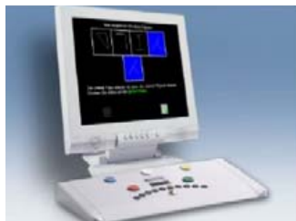
شکل (۱) - تست کامپیوتری COG

در جلسه دوم شرکت کنندگان قبل از شروع شیفت و در جلسه سوم بعد از پایان همان شیفت (اعم از شب و روز) تست های کامپیوتری مورد نظر را انجام دادند. ملاحظات اخلاقی: همه داوطلبان فرم رضایت آگاهانه را امضا کردند و به منظور تامین انگیزه لازم برای ارایه بهترین عمل کرد توسط شرکت کنندگان، متناسب با نمره کسب شده در جلسه دوم و سوم، به ایشان پاداش نقدی به مقدار حداکثر