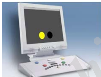
شکل (۲) - تست کامپیوتری RT