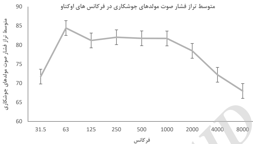
شکل (۲) - متوسط تراز فشار صوت مولد های جوش کاری در فرکانس های اوتکتا

که در شرایط خاموش بودن مولد های دیزلی اندازه گیری شده بود، از حدود مجاز سازمان محیط زیست (۵۵ دسی بل در طی ساعات ۸ صبح الی ۱۰ شب) تجاوز کرده بود و این تجاوز از حدود مجاز به دلیل صدای ناشی از ترافیک و تردد خودروها در اطراف سایت های ساخت و ساز بود. (جدول ۱) لذا با توجه به صدای زمینه موجود، حتی در شرایطی که مولدهای دیزلی خاموش هستند صدا از حدود مجاز سازمان محیط زیست تجاوز خواهد کرد و در صورت استفاده از استاندارد موجود سازمان محیط زیست ارزیابی صحیحی از صدای ناشی از مولد های دیزلی صورت نخواهد گرفت. در این مطالعه، حدود مجاز صدای محیط زیستی با اقتباس از استاندارد BS 5228 (صدای زمینه به اضافه ۵ دسی بل) بر اساس صدای زمینه موجود در هریک از سایت های ساخت و ساز به دست آمد، لذا هریک از سایت های ساخت و ساز حدود مجاز مختص به خود را خواهد داشت. متوسط تراز صدای زمینه در ۱۴ سایت ساخت و ساز بررسی شده در این مطالعه ۴۶/۲۰ دسی بل اندازه گیری