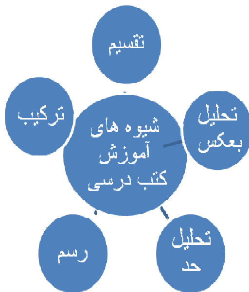
شکل ۱: شیوه های آموزشی در کتب دوران حکیم

علی بن عباس مجوسی اهوازی (که به اعتقاد بسیاری خود و پدرش مسلمان بوده اند و اجدادش زرتشتی) کتاب کامل الصنعه را برای انتقال دانش طب به شاگردان و آیندگان تقریر کرده است. طب ملکی حدود چهارصد هزار کلمه و بیست مقاله دارد که هریک مشتمل بر چند فصل است، تقسیم می‌شود که ده مقاله اول آن درباره طب نظری است و بقیه مربوط به طب عملی است (۲). او روش آموزشی نگارشی خود را در تدوین و تقریر این کتاب روش تقسیم معرفی می‌کند (۲ و ۷).