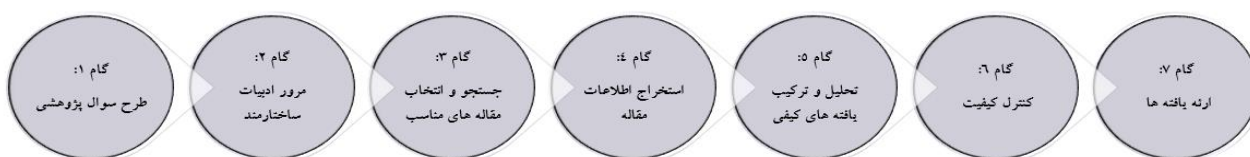
شکل ۱: گام‌های فراترکیب بر اساس روش هفت مرحله‌ای سندلوسکی و باروس

شوند و مورد مطالعه قرار گرفتند. برای دستیابی به هدف پژوهش از روش فراترکیب، مطابق با الگوی سندلوسکی و باروس استفاده شد که خلاصه این مراحل در شکل ۱ نشان داده شده است.