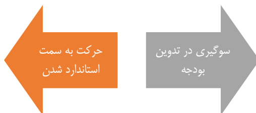
شکل ۲: پیامدهای الگوی چارچوب ذهنی درک ذهنی مشارکت‌کنندگان در فرایند تدوین بودجه (خرج‌کنندگان بودجه در مقابل نگهداران بودجه)

همان‌طور که در شکل شماره ۲ نشان داده شده است، دو پیامد (سوگیری در تدوین بودجه و حرکت به سمت استاندارد شدن) در خلاف جهت هم قرار