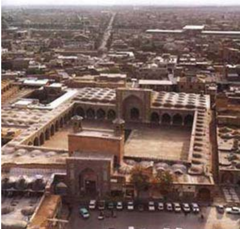
Vakil Mosque, Belongs to Zandieh dynasty (۱۷۹۴-۱۷۵۰ AD), Shiraz, Iran