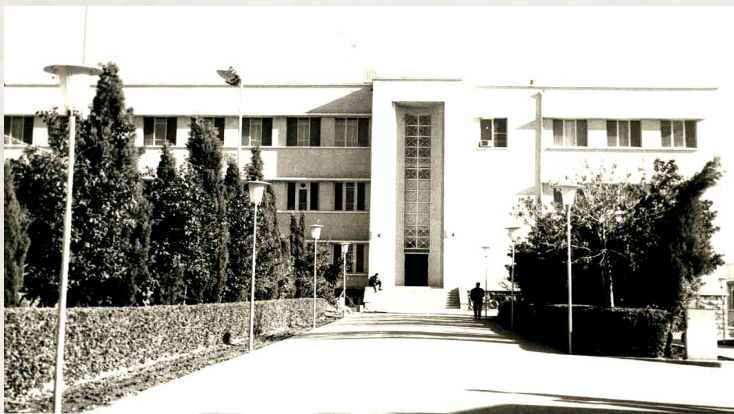
تصویر ۳. دانشکده پزشکی شیراز در دهه ۵۰