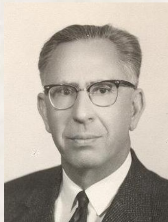
تصویر ۲. دکتر ذبیح الله قربان بنیانگذار دانشکده پزشکی شیراز