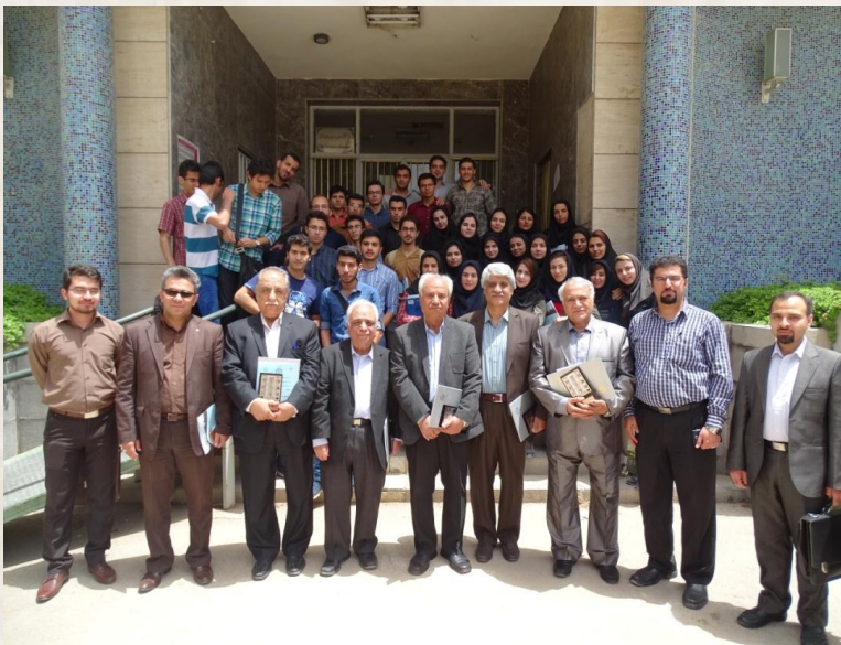
تصویر ۵. عکس یادمان تعدادی از اساتید پیشکسوت دانشکده با اساتید و دانشجویان جوان، پس از پایان سمینار