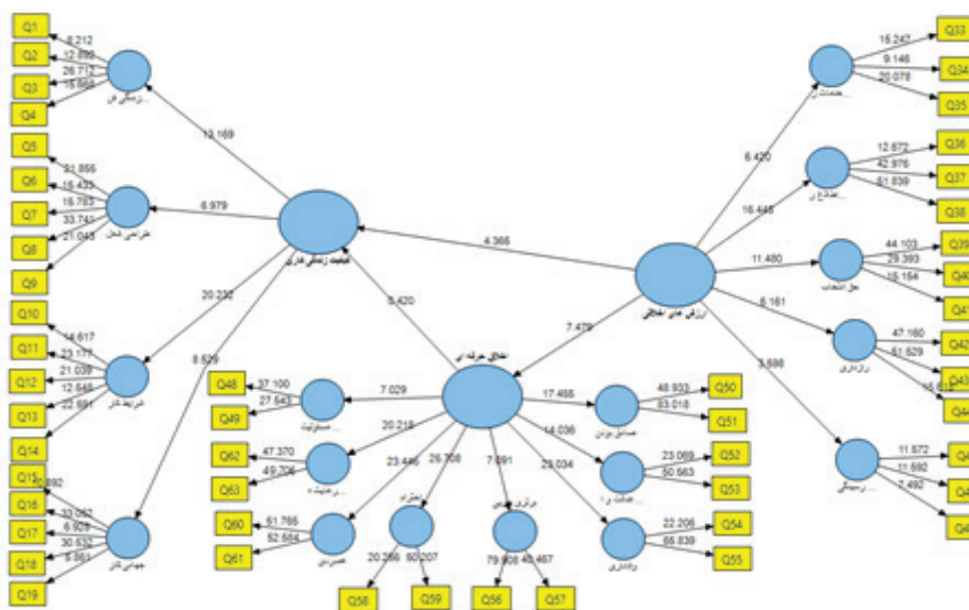
نمودار ۲: مدل پژوهش در حالت معنی‌داری ضرایب

(نمودار ۲) مدل تحقیق در حالت معنی‌داری ضرایب (T-value) را نشان می‌دهد.