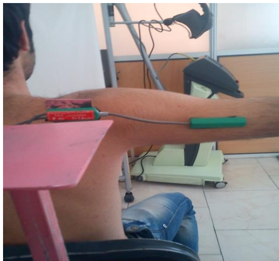
تصویر ۱: نحوه چسباندن سرهای الکتروگونیا متر برای اندازه گیری حرکت ابداکشن در وضعیت ۹۰ درجه ابداکشن (وضعیت صفر آزمون)

برای اندازه گیری حرکت دور کردن بازو از بدن دست فرد در وضعیت ۹۰ درجه ابداکشن روی تخت کنار صندلی بیمار که ارتفاع آن قابل تنظیم بود قرار می گرفت. شست آزمودنی به سمت سقف بود. یکی از سرهای الکتروگونیا متر روی ناحیه فوقانی خلفی بازو در امتداد استخوان هومروس چسبانده و سر دیگر آن روی پایه مدرجی که توسط تیم تحقیق طراحی و ساخته شده بود چسبانده می شد. پایه مدرج پشت سر بیمار در خط وسط قرار داشت تا تغییرات زاویه نسبت به یک نقطه ثابت خارج از بدن آزمودنی سنجیده شود (شکل ۱)، چرا که یکی از مشکلات اساسی در اندازه گیری خطای بازسازی زاویه مفصل شانه تحرک زیاد این مفصل و جا به جایی پوست اطراف آن است بنابراین و با توجه به این که اندازه گیری زاویه مفصل در یک صفحه حرکتی صورت می گرفت برای به حداقل رساندن این خطا، اندازه گیری نسبت به یک نقطه ثابت در بیرون بدن فرد انجام گرفت. این وضعیت به عنوان وضعیت صفر درجه در نظر گرفته شد. سپس اندام آزمودنی توسط آزمون گر از همان وضعیت و در صفحه فرونتال تا انتهای دامنه موجود ابداکشن برده می شد. کل دامنه دور کردن بازو از بدن به عنوان دامنه موجود ثبت و زوایای هدف محاسبه می گردید.