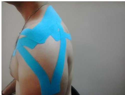
تصویر ۲: روش چسباندن کینزیوتیپ روی عضلات پکتورالیس ماژور، فیبرهای عرضی تراپزیوس، سوپراسپیناتوس و دلتوئید