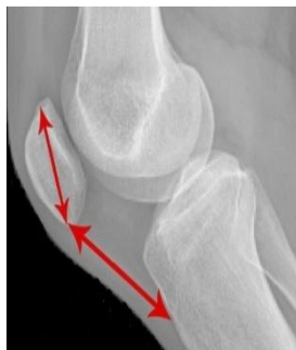
تصویر ۳: نحوه اندازه گیری طول کشکک (مقیاس اینسال - سالواتی)

اندازه گیری طول کشکک با استفاده از مقیاس اینسال - سالواتی (Insall-Salvati index) صورت گرفت. بدین منظور در نمای لترال، خطی که از لبه تحتانی کشکک به برجستگی قدامی تیبیا متصل میشود و بلندترین محور مورب کشکک با استفاده از کولیس، اندازه گیری شد، نسبت این دو خط، میزان آلتا یا باجای کشکک را نشان می دهد [۲۶، ۲۷، ۳۹]. نسبت کمتر از ۰/۸ پتلا باجا و بزرگتر از ۱/۲ پتلا آلتا گفته می شود [۳۹، ۲۶] (تصویر ۳).