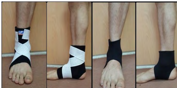
تصویر ۳: بریس نئوپرینی تصویر ۴: بریس بنددار