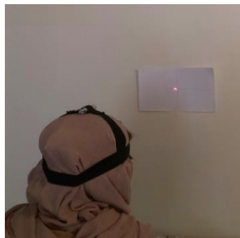
تصویر ۱: نحوه اندازه‌گیری زاویه خطای بازسازی

برای اندازه‌گیری دامنه حرکتی فلکسیون و اکستنسین گردنی زاویه بین خط عمود بر زمین با خط افقی که از سوراخ گوش خارجی می‌گذشت، اندازه‌گیری شد. محور حرکت سوراخ گوش خارجی بود. برای فلکسیون جانبی زاویه بین خط مرجع افقی که از شکاف استرنال و زواید آکرومیون می‌گذشت با خط وسط بینی بیمار اندازه‌گیری شد و محور حرکت شکاف استرنال بود. برای روتاسیون نیز فرد روی صندلی نشسته و بازوها آویزان بود در حالی که از بالا و پشت به سر بیمار نگاه می‌شد، محور حرکت وسط سر بیمار بود که زاویه بین خط فرضی که از زواید آکرومیون می‌گذشت را با خطی که در امتداد بینی بیمار بود، اندازه‌گیری شد. [۱۸] به منظور ارزیابی خطای بازسازی مفصلی بیمار در حالت نشسته بر روی صندلی با تکیه‌گاه به صورت ریلکس نشست و در مقابل او به فاصله ۹۰ سانتی‌متر صفحه مدرج نصب شده روی دیوار قرار گرفت؛ در حالی که یک کلاه سبک که توسط بندهایی روی سر بیمار ثابت شده بود و بر روی این کلاه یک قلم لیزری یا نشانگر نور لیزری متصل بود، از بیمار خواسته شد تا سر خود را در وضعیت کاملاً راحت قرار دهد و این وضعیت را به ذهن بسپارد و نقطه‌ای که نشانگر نور لیزر نشان داد علامت‌گذاری شد. این نقطه، نقطه مرجع نامیده می‌شود (تصویر ۱).