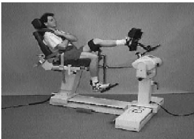
تصویر ۱. دستگاه ایزو کینتیک

عضلانی، سابقه سرگیجه و مشکلات بینایی اصلاح‌نشده، تغییرات حسی اندام تحتانی، سابقه هر گونه آسیب مچ پا در طی سه ماه اخیر، عدم استفاده کردن از بریس مچ پا در طول تحقیق، از جمله شرایط ورود به تحقیق بود. قبل از شروع تحقیق، مراحل انجام تحقیق برای افراد شرح داده شد. سپس از افراد خواسته شد تا در صورت تمایل برای انجام بررسی‌های اولیه در ساعات مشخص‌شده به سالن ورزشی مورد نظر مراجعه کنند. همچنین برای افراد شرح داده شد که در هر زمان از مراحل انجام تحقیق در صورت عدم تمایل به ادامه همکاری می‌توانند انصراف دهند. قبل از هر گونه اندازه‌گیری، آزمودنی‌ها ابتدا فرم رضایت‌نامه کتبی شرکت در آزمون را تکمیل کردند و اطلاعات شخصی آنها جمع‌آوری گردید. به منظور تعیین صلاحیت شرکت‌کنندگان میزان ناپایداری مچ پای آنها با استفاده از پرسش‌نامه ناپایداری مچ پای کامبرلند ۲ و آزمون بالینی کشویی قدامی ۳ ارزیابی شد. پرسش‌نامه کامبرلند دارای ۹ سوال است که شدت ناپایداری عملکردی مچ هر دو پا را مشخص می‌کند. دامنه نمره ثبات عملکردی مچ هر پا بین صفر تا ۳۰ امتیاز است، به طوری که هر چه نمره فرد از ۲۷ به صفر کاهش یابد، شدت ناپایداری مچ پا بیشتر می‌شود. آزمودنی‌ها قبل از اجرای برنامه‌های مداخله-ای (۶ هفته تمرین تعادلی و تیبینگ)، آزمون سنجش حس عمقی با استفاده از دستگاه ایزو کینتیک (بایودکس، مدل ۲۰۰۳؛ ICC=۰/۹۹) و آزمون عملکردی Eight Hop Test را نیز به صورت میدانی به عنوان پیش‌آزمون انجام دادند (تصویر ۱). اندازه‌گیری‌های حس عمقی در زوایای ۱۰ درجه دورسی‌فلکشن و ۲۰ درجه پلان‌تارفلکشن مچ پا انجام گرفت. [۱۴]