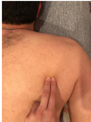
تصویر ۲: نحوه لمس عضله اینفراسپاناتوس اینفراسپاناتوس اینفراسپاناتوس

عضله اینفراسپاناتوس از دو سوم داخلی حفره اینفراسپاناتوس و فاسیای اینفراسپاناتوس منشا گرفته و به رویه میانی تکه بزرگ هومروس متصل می شود. [12] برای عضله اینفراسپاناتوس نیز در حالت دمر خوابیده دردناکترین نقطه ماشه ای در باند سفت شده علامتگذاری می شد. (شکل ۲)