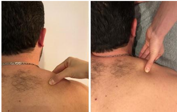
تصویر ۱: نحوه لمس عضله تراپزیوس فوقانی در دو وضعیت ایستاده (چپ) و خوابیده (راست)

خارجی ترقوه متصل می شود. [12] برای تعیین محل دردناکترین نقطه ماشه ای عضله تراپزیوس فوقانی آزمونگر در دو وضعیت نشسته و دمر خوابیده با لمس انبری آن نقطه را شناسایی و علامت گذاری می کرد (تصویر ۱)