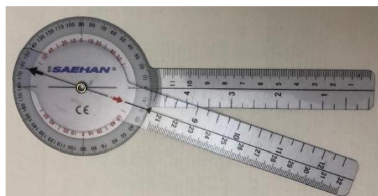
تصویر ۵: گونیامتر

مداخله در هر بیمار تنها یک جلسه انجام شد و معیار دیداری درد شانه (VAS) و دامنه حرکتی فعال و بدون درد ابداعش شانه قبل از مداخله و نیز یک هفته بعد از مداخله اندازه گیری شد. برای اندازه گیری VAS از بیمار خواسته شد میزان دردش را روی یک خط ده سانتی متری مشخص کند. سپس عدد با خط کش بر حسب میلی متر اندازه گیری شد. برای اندازه گیری دامنه حرکتی فعال بدون درد ابداعش شانه از گونیامتر دستی SAEHAN استفاده شد. (شکل ۵) بدین صورت که بیمار نشسته، محور گونیامتر در مرکز مفصل شانه از پشت شانه قرار گرفت. بازوی ثابت به موازات محور طولی تنه و بازوی متحرک به موازات محور طولی هومروس قرار داده شد. بیمار بازو را از کنار تنه تا حد دامنه بدون درد دور کرد و زاویه آن توسط آزمونگر ثبت گشت.