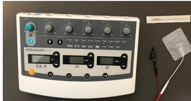
تصویر ۳: دستگاه ES-160 By ITO