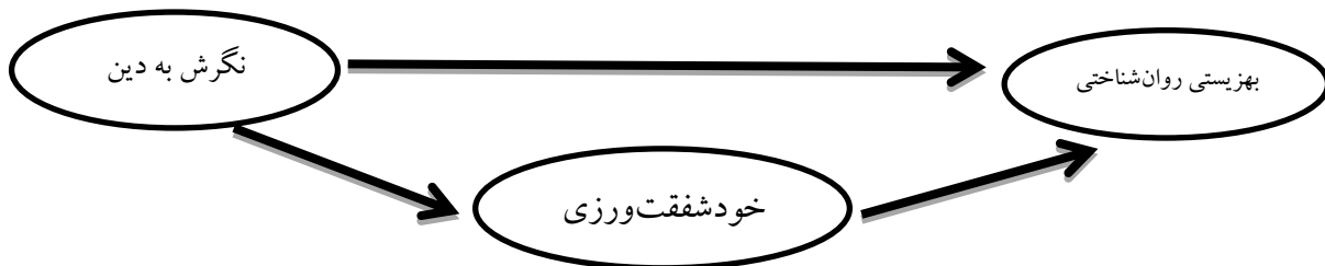
تصویر ۱: مدل مفهومی بهزیستی روان‌شناختی بر پایه دین‌داری