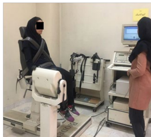
تصویر ۲. الف). انجام آزمون فلکشن و اکستنشن زانو به صورت زنجیره باز حرکتی با دستگاه ایزوکتیک با یو دکس ب). انجام آزمون فلکشن و اکستنشن زانو به صورت زنجیره بسته حرکتی با دستگاه ایزوکتیک با یو دکس