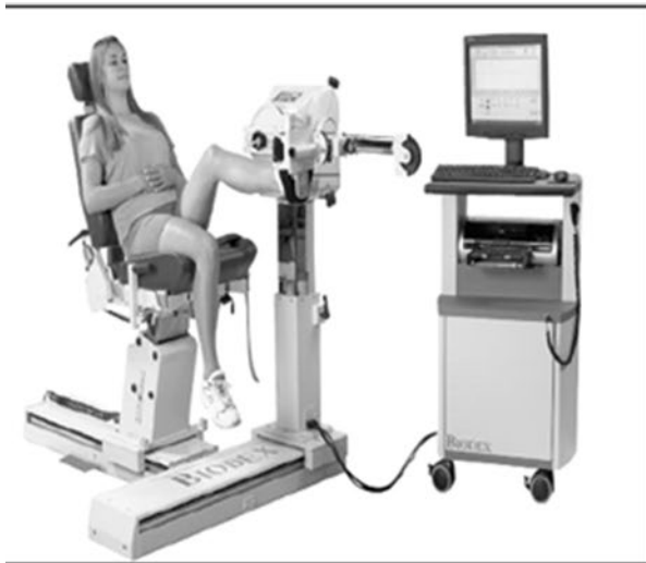
تصویر ۱. الف) انجام تست فلکشن و اکستنشن زانو به صورت زنجیره باز ب) انجام تست فلکشن و اکستنشن زانو با زنجیره بسته [۲۴]

یک زنجیره حرکتی باز ترکیبی از قرارگیری مفاصل طوری که انتهای اندام باز است و آزادانه حرکت می‌کند، تعریف می‌شود. [۲] در مقابل یک سیستم زمانی بسته در نظر گرفته می‌شود که قسمت پروگزیمال با بسته شدن و بی حرکت شدن قسمت دیستال می‌تواند حرکت کند. از منظر نوروفیزیولوژیک، حرکت به صورت زنجیره بسته عمدتاً یک حرکت چندمفصلی با هم‌انقباضی یا سینرژی‌های عضلانی کنترل شده است [۳] یا به عبارتی دیگر، حرکت یا تمرین با تحمل وزن که عضلات درگیر در چند مفصل عمل می‌کنند، است. [۴-۵] بهینه‌سازی اشکال مختلف تمرین و آموزش در ورزش و درمان به‌ویژه استفاده از تمرینات زنجیره‌ای، از گذشته مورد بحث بوده است [۳] به‌ویژه استفاده از تمرینات زنجیره‌ای، با اصطلاح تمرینات با زنجیره باز و بسته مکرراً یک نقطه مشترک مورد بحث بین افراد بوده است. [۳]