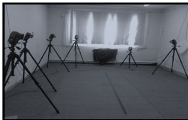
تصویر ۱. محل قرارگیری ۶ دوربین اپتوالکترونیک نسبت به تردمیل

پس از انتخاب آزمودنی‌ها، فرم رضایت‌نامه جهت همکاری در پژوهش به آنها داده شد و بعد از آن که آزمودنی‌ها تمایل خود را جهت شرکت در این تحقیق نشان دادند، در دو گروه مبتلا به PFPS و گروه افراد سالم طبقه‌بندی شدند. برای ثبت سه‌بعدی راه رفتن آزمودنی‌ها از سیستم اپتوالکترونیک سه‌بعدی Motion Analysis (مدل Raptor-H Digital Real Time System ساخت کشور آمریکا) با شش دوربین و نرم‌افزار Cortex برای تحلیل داده‌های جمع‌آوری‌شده نسخه 2.5.0.1160-64 bit بهره گرفته شد. برای این تحقیق، فرکانس دوربین‌ها ۱۲۰ هرتز در نظر گرفته شد. [۱۴ و ۱۵] چیدمان دوربین‌ها به نحوی بود که هر مارکر در هر لحظه حداقل توسط دو دوربین رؤیت می‌شد. کالیبره کردن دوربین‌ها به شکلی بود که محور X در امتداد مسیر گام-برداری و عمود بر صفحه فرونتال آزمودنی‌ها قرار می‌گرفت. حجم کالیبراسیون نیز به اندازه‌ای بود که تردمیل و آزمودنی را به‌طور کامل پوشش می‌داد. این حجم دارای ۲/۵ متر طول، ۱/۵ متر عرض و ۲ متر ارتفاع بود.