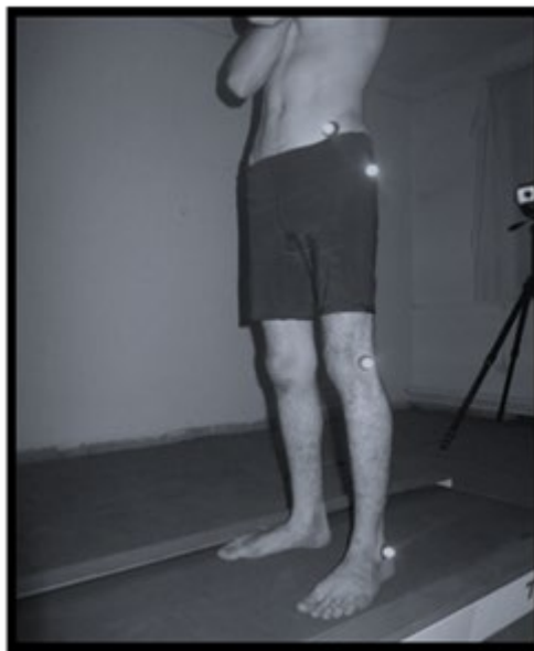
تصویر ۲. محل قرارگیری مارکرهاى انعکاسی روی بدن آزمودنی

پس از آماده کردن مقدمات کار، برای جلوگیری از حرکات مارکرها و ثبت دقیق‌تر تصاویر از آزمودنی‌ها خواسته شد با حداقل لباس ممکن در تست‌گیری شرکت کنند. سپس چهار ماکر انعکاسی پسیو بر موقعیت‌های مورد نظر قرار داده شد. این محل‌ها شامل خار خاصره‌ای قدامی-فوقانی سمت راست، برجستگی بزرگ استخوان ران سمت راست، کندیل خارجی زانوی پای راست و قوزک خارجی مچ پای راست بودند. [۱۶] مارکرها با استفاده از چسب دوطرفه بر بدن آزمودنی‌ها فیکس شد (این نوع چیدمان مارکر، مخصوص افرادی است که در مفصل کشکی رانی پای سمت راست و یا هر دو مفصل کشکی رانی دچار عارضه می‌باشند). در افرادی که در پای چپ دچار سندروم درد کشکی رانی هستند، چیدمان مارکرهاى فوق به سمت چپ بدن انتقال می‌یافت، سپس افراد با قرار گرفتن بر روی ترمیل با شیب صفر درجه، شروع به دویدن می‌کنند، پس از اینکه به آزمودنی‌ها