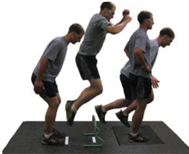
تصویر ۱. آزمون پرش فرود تک پا