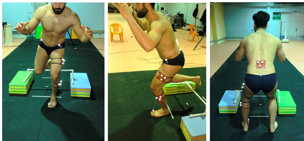
تصویر ۳. روش مارکرگذاری جهت آنالیز سه‌بعدی حرکت تکلیف پرش-فرود تک‌پا

اپتوالکتریک مادون قرمز با فرکانس نمونه‌برداری ۱۲۰ هرتز برای ثبت حرکات استفاده گردید. [۱۹] دو وضعیت استاتیک و اجرای آزمون فرود پای برتر آزمودنی‌ها در یک فضای سه‌بعدی کالیبراسیون‌شده، ترکینگ شد. مارکرگذاری به شیوه سه‌بعدی انجام شد. در مارکرگذاری این نمونه‌برداری سعی بر این شد که هر سگمنت حداقل با سه نشانگر تعریف و شناسایی شود؛ به این صورت که بر روی ساق ۳ عدد مارکر، بر روی ران ۳ مارکر، ۲ مارکر بر روی خار خارصه قدامی-فوقانی ۱ ، ۲ مارکر بر روی خار خارصه خلفی-فوقانی ۲ ، ۱ مارکر بر روی شست و ۱ مارکر روی L5 جهت شناسایی مرکز ثقل (جمعا ۱۲ عدد) [۲۰] با قطر 19 میلی‌متر به‌صورت غیرهمراستا نصب شد (تصویر ۳). فاکتورهای کینماتیکی اندام تحتانی و تنه در حین فرود تک‌پا شامل زوایای فلکشن زانو، ران و تنه در سطح ساجیتال و ابداکشن و اداکشن زانو و فلکشن جانبی تنه در سطح فرونتال اندازه‌گیری شد. دامنه حرکتی مفصل در سطح ساجیتال و فرونتال به‌عنوان تفاوت بین تماس اولیه پا با زمین و زاویه حداکثر (پیک) در طی چرخه فرود