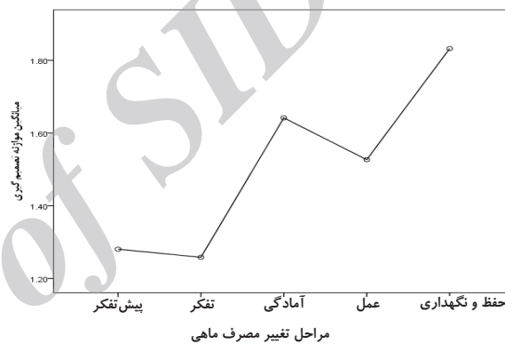
نمودار ۱. روند تغییرات موازنه تصمیم‌گیری نسبت به مصرف ماهی بر حسب مراحل تغییر

نتایج ANOVA نشان داد که بین مراحل تغییر مصرف ماهی با سازه موازنه تصمیم‌گیری تفاوت معناداری وجود دارد ( p < 0/05 ). پس از معنادار شدن آنالیز واریانس یک‌طرفه، آزمون روند خطی نیز انجام گرفت. بر این اساس، موازنه تصمیم‌گیری دارای روند خطی معنادار بود ( p = 0/001 ). موازنه تصمیم‌گیری در مراحل تغییر دارای روند خطی افزایشی بود؛ به عبارت دیگر، با پیشرفت افراد از مرحله پیش از قصد تا مرحله حفظ و نگهداری، موازنه تصمیم‌گیری به‌طور خطی افزایش می‌یافت (نمودار ۱).