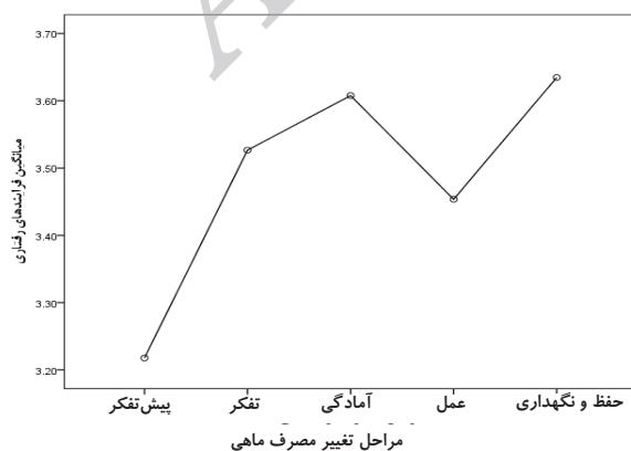
نمودار ۴. روند تغییرات فرایندهای رفتاری نسبت به مصرف ماهی بر حسب مراحل تغییر

نتایج ANOVA نشان داد که بین مراحل تغییر مصرف ماهی با سازه موازنه تصمیم‌گیری تفاوت معناداری وجود دارد ( p < 0/05 ). پس از معنادار شدن آنالیز واریانس یک‌طرفه، آزمون روند خطی نیز انجام گرفت. بر این اساس، موازنه تصمیم‌گیری دارای روند خطی معنادار بود ( p = 0/001 ). موازنه تصمیم‌گیری در مراحل تغییر دارای روند خطی افزایشی بود؛ به عبارت دیگر، با پیشرفت افراد از مرحله پیش از قصد تا مرحله حفظ و نگهداری، موازنه تصمیم‌گیری به‌طور خطی افزایش می‌یافت (نمودار ۱).