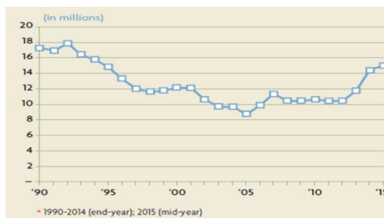
نمودار ۱. روند تعداد آوارگان تحت پوشش کمیساریای عالی پناهندگان طی سال‌های ۱۹۹۰ - ۲۰۱۵ (منبع: سایت کمیساریای عالی امور پناهندگان سازمان ملل به آدرس www.unhcr.org )

محققین در زمینه بلایا به این نتیجه رسیده‌اند که وقوع بلایا اعم از طبیعی یا انسان‌ساخت وضعیت استرس‌زایی است که زندگی روزمره افراد را تحت تأثیر قرار داده و سیستم‌های اجتماعی را در یک موقعیت جغرافیایی خاص مختل می‌کند (۱۰، ۱۱). با توجه به افزایش تعداد حوادث و بلایا، روند روبه‌رشد آوارگی در جهان (نمودار شماره ۱) به‌عنوان یکی از معضلات جامعه جهانی در سالیان اخیر مطرح شده است (۱۲). براساس آمارهای منتشرشده از سوی کمیساریای عالی امور پناهندگان تا پایان سال ۲۰۱۵ بیشترین تعداد آوارگان مربوط به کشورهای سوریه، افغانستان، سومالی و سودان بوده‌اند (نمودار شماره ۲) و تا نیمه نخست سال ۲۰۱۵، پنج کشور ترکیه، پاکستان، لبنان، ایران و اتیوپی میزبان بالاترین تعداد آوارگان در جهان بوده‌اند (نمودار شماره ۳). ایران با پذیرش ۹۸۱۰۰۰ نفر از آوارگان که ۹۵۱۰۰۰ نفر از اتباع افغان و ۲۸۳۰۰۰ نفر از آوارگان عراقی هستند، جزو پنج کشور اول جهان در پذیرش آوارگان است (۲). به دنبال اختلالات سیاسی در افغانستان، جمهوری اسلامی ایران و پاکستان طی سه دهه گذشته تعداد زیادی از آوارگان افغان را پذیرا بوده‌اند. ۹۷ درصد آوارگان افغان در مناطق شهری ایران زندگی می‌کنند؛ در حالی که ۳ درصد در کمپ‌ها و اردوگاه‌های تحت حمایت دولت، کمیساریای عالی پناهندگان سازمان ملل متحد و سازمان‌های غیردولتی خارجی ساکن هستند. در سال ۲۰۱۵، کمتر از نیمی از مهاجران بین‌المللی (۴۷٪) در ایران زنان بودند؛ اما به وضعیت سلامت این گروه از افراد در کشورهای میزبان از جمله ایران به‌عنوان یکی از ۵ کشور مطرح جهان در پذیرش آوارگان، هرگز به‌طور جامع توجه نشده است (۱۳).