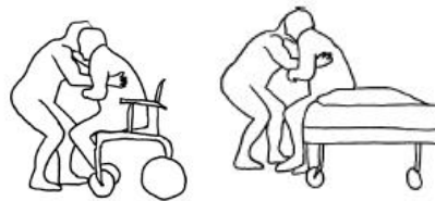
وظیفه ۲. بلند کردن بیمار از تخت

کمک بهیاران مورد مطالعه در محیط بیمارستان ۴ وظیفه مورد بررسی که به صورت شماتیک در شکل ۱ نشان داده شده است را