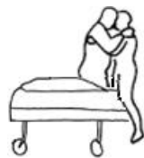
وظیفه ۴. نشان دادن بیمار روی تخت