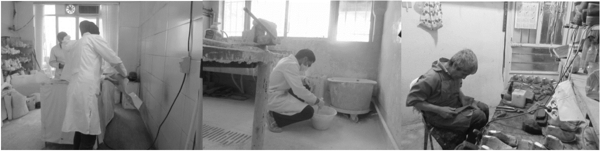
شکل ۱: برخی از پوسچر های نامطلوب افراد حین انجام کار در کلینیک ساخت اعضای مصنوعی و وسایل کمکی در انجام وظایف کفاشی، پرکردن قالب و کار با سمباده. الف) کفاشی، ب) پر کردن قالب نگاتیو از گچ، پ) کار با دستگاه سمباده

و اره برای برش اعمال کند که نبودن تکیه‌گاه جهت قرارگیری قالب بر روی آن نیز باعث تشدید موارد گفته شده می‌شود. استفاده از اره برقی ایستاده و ثابت و همین‌طور استفاده از سکویی (Stand) که قالب‌ها بر روی آن قرار گیرد، می‌تواند از فشار وارد آمده به فرد و پوسچر های نامطلوب وی حین انجام کار جلوگیری نمود. برش ورق‌های فلزی با استفاده از گیوتین نیز به دلیل اعمال نیرو جهت نگه‌داشتن ورق فلزی در ارتفاع پایین (در مواردی که گیوتین بر روی زمین قرار گرفته است) و در ارتفاع بالا (در مواردی که گیوتین بر روی میز قرار گرفته است) و همچنین دور شدن بازوها از بدن به دلیل وجود دسته‌بلند گیوتین و اعمال نیرو بر آن، می‌تواند آسیب‌هایی را به اندام‌های درگیر وارد کند. در اکثر مطالعات انجام شده، پوسچر نامطلوب به‌عنوان عامل مهم در وقوع اختلالات اسکلتی-عضلانی، شناخته شده است. دلیل اصلی پوسچر غیرطبیعی و ثابت را می‌توان ایستگاه‌های کار غیرقابل تنظیم دانست (۸). در مطالعاتی که توسط چوبینه و همکاران (۸)، لین و چن (۱۸) و ویکی و متیلا (۵) بطور جداگانه انجام شده است، نشان داده‌اند که پوسچر کاری می‌تواند در بروز اختلالات اسکلتی-عضلانی مؤثر باشد.