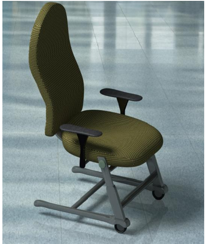
شکل ۳: نمای ایزومتریک پروتوتایپ

خوشبختانه، ارتقا سطح دانش عمومی و بالا رفتن توانمندی‌های بالقوه شاغلین از یک طرف، و پیاده‌سازی برنامه‌های ارگونومی از طرف دیگر، زمینه‌ساز افزایش روز افزون کیفیت محصولات مورد استفاده، و نیز طراحی بهینه ابعاد مختلف ایستگاه‌های متنوع کاری در صنایع مختلف کشورمان بوده است. نتایج حاصل از این مطالعه نیز ضمن تأکید بر لزوم اجرای مطالعات کمی در محیط‌های صنعتی، حاکی از موفقیت آمیز بودن جلب مشارکت کارکنان در طراحی محیط کار و رفع نقاط ضعف موجود می‌باشد.