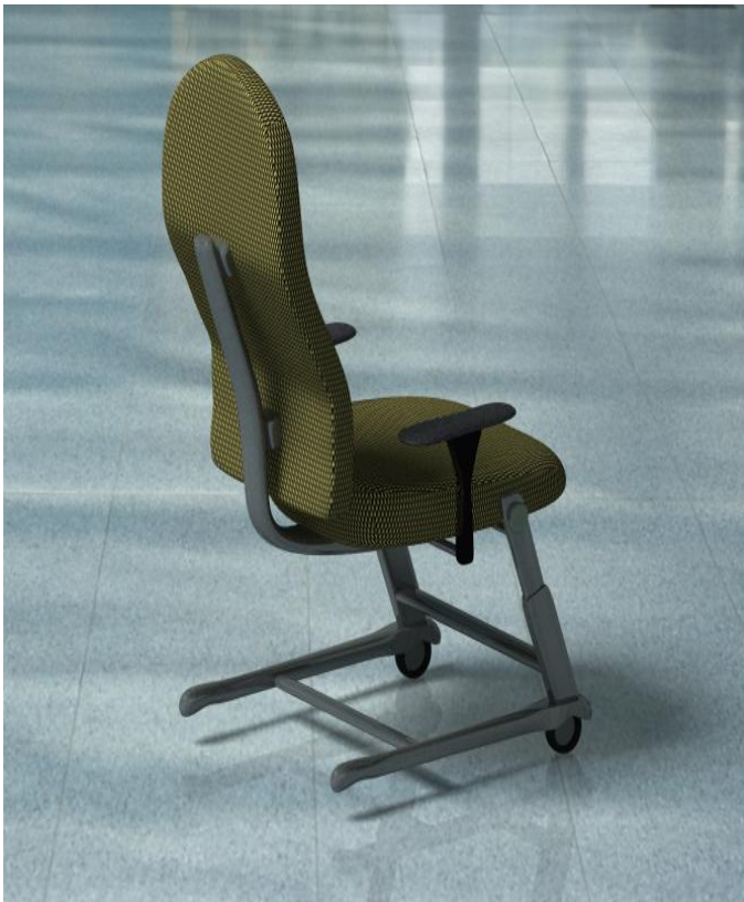
شکل ۲: نمای ایزومتریکی پروتوتایپ

با توجه به نتایج حاصل از این مطالعه، شرکت‌کنندگان، ثابت بودن صندلی و دشوار بودن جابجایی آن را جز مشکلات استفاده از صندلی‌های موجود برشمردند؛ و چرخ‌دار بودن صندلی جهت جابجایی راحت آن را به عنوان راه حل ذکر کردند. همچنین چهار پره بودن پایه صندلی را یکی از مشکلات آن ذکر کرده و استفاده از ۵ پره به جای ۴ پره، جهت حفظ تعادل بیشتر را پیشنهاد نمودند. اما از آنجا که یکی دیگر از مشکلات صندلی‌های موجود، گیر کردن پایه صندلی به میز و ممانعت از جلو آمدن آن بود، خود شرکت‌کنندگان، استفاده از پایه‌های مثلی را برای جلوگیری از برخورد آن با میز کار، توصیه کردند. مدل مفهومی صندلی صنعتی در این مطالعه که مطابق با خصوصیات آنتروپومتریکی جمعیت آماری و نیز ملاحظات شناختی آنان در رابطه با ویژگی‌های مربوطه طراحی شد در شکل‌های ۲ و ۳ نمایش داده شده است.