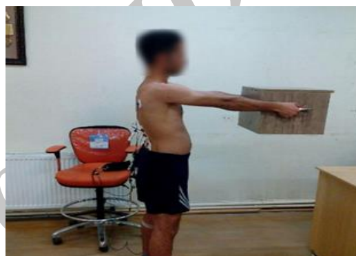
شکل ۱. نحوه قرارگیری آزمودنی‌ها برای انجام آزمایش‌ها

موفق) انجام شد و میانگین متغیرهای مربوط، در ۵ حرکت محاسبه شد. بین تلاش‌های آزمون در هر کدام از دو وضعیت (همچنین بین تعویض آزمون‌ها از حالت نگه‌داشتن ایستا به حالت برداشتن پویا)، دست‌کم ۳۰ دقیقه به آزمودنی‌ها استراحت داده می‌شد تا خستگی انجام تست برطرف شود. نحوه انجام آزمون‌ها نیز در وضعیت‌های با گوه پاشنه و بدون آن، به صورت تصادفی بود تا اثر یادگیری و ترتیب اجرای آزمون روی داده‌های ثبت شده خنثی شود. گوه استفاده شده در پژوهش حاضر از جنس چوب با این ابعاد بود: طول ۷ سانتی متر، عرض ۵ سانتی متر و ارتفاع ۱ سانتی متر با زاویه ۸ درجه، که میان چوب در زیر پاشنه پاها قرار داده می‌شد [۹].