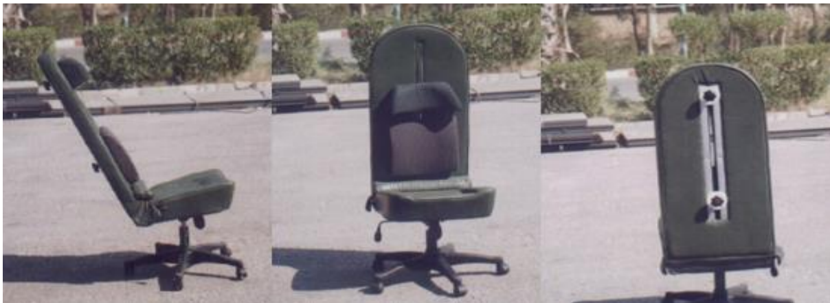
شکل ۳. صندلی ارگونومی ساخته شده، از نماهای مختلف

خواهد داشت [۱۶، ۱۷]. قابلیت انعطاف سطح نشستن گاه نیز باید آن قدر باشد که انتقال نیروی عکس العمل از سطح نشستن گاه به برجستگی های ورک منتقل شود. در غیر این صورت شخص در ناحیه پشت احساس ناراحتی می کند. در این مطالعه، قابلیت انعطاف سطح نشستن گاه، با استفاده از استاندارد MIT که پیش تر محاسبه شد، به دست آمد.