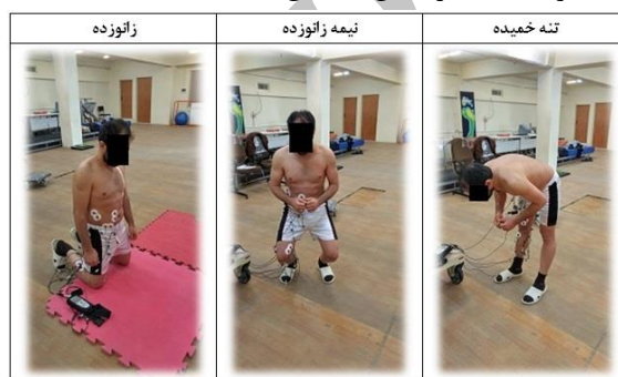
شکل ۱. پوسچرهای ارزیابی شده در مطالعه

با بررسی فرایند جوشکاری در خطوط انتقال گاز، مصاحبه با جوشکاران و همچنین بررسی عکس‌ها و فیلم‌های تهیه شده از آنها هنگام جوشکاری در مناطق عملیاتی، پوسچرهای غالبی که جوشکاران هنگام کار داشتند شناسایی شد. این پوسچرها شامل سه پوسچر تنه خمیده به سمت جلو (تنه با زاویه ۹۰ درجه نسبت به محور عمودی بدن)، پوسچر نیمه زانورده (زاویه فلکشن زانو ۱۲۰ درجه) و پوسچر زانورده (هر دو زانوی فرد روی زمین قرار دارد و تنه بدون زاویه نسبت به محور عمودی بدن) بودند. پوسچرهای ارزیابی شده در مطالعه، در شکل ۱ نشان داده شده است.