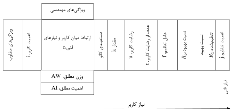
شکل ۲. شکل توسعه ویژگی‌ها (HOQ)

شکل ۲ ماتریس کیفیت HOQ را نشان می‌دهد، که در این بررسی اجرا شده است. همان‌طور که در این ماتریس دیده می‌شود، نتایج مرتبط با انتظارات کاربر، که از طریق