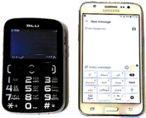
شکل ۱. گوشی لمسی مدل Galaxy J5 Prime (شکل سمت راست) و گوشی دکمه‌ای BLU مدل JOY (شکل سمت چپ)

برای این پژوهش گوشی لمسی سامسونگ مدل Galaxy Prime J5 انتخاب شد. طبق آخرین گزارش‌ها بین بیش از ۳۶ میلیون کاربر دستگاه اندرویدی ایرانی گوشی سامسونگ مدل Prime J5 بیشترین کاربر را دارد [۱۹]. همچنین از گوشی BLU مدل JOY، به دلیل داشتن دکمه‌هایی با سایز بزرگ و دکمه تماس اضطراری (SOS) مخصوص سالمندان، به‌عنوان گوشی دکمه‌ای استفاده شد. نوع و سایز صفحه‌کلید گوشی لمسی به شکل گوشی دکمه‌ای شبیه‌سازی شد تا عملکرد تایپ در هر دو گوشی در شرایط یکسان صورت گیرد (شکل ۱).