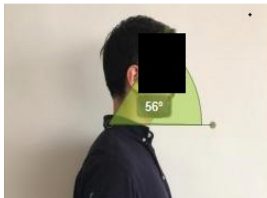
شکل ۱. اندازه‌گیری زاویه قرارگیری سر با استفاده از نرم‌افزار کینوا [۳۰]

از فرم میزان اعتیاد به تلفن همراه هوشمند (SAS ۳ ) (ساخت کشور کره) برای ارزیابی میزان درجه وابستگی کاربران استفاده شد. این فرم ۳۳ سؤال و ۶ مقیاس دارد که در آن عدد ۱ نشان‌دهنده کمترین درجه موافقت و عدد ۶ نشان‌دهنده بیشترین درجه موافقت با هر سؤال است. طبق این فرم کسانی که امتیاز ۹۹ و کمتر از آن را کسب کنند کاربر کوتاه‌مدت و کسانی که امتیاز بالاتر از ۹۹ را کسب کنند کاربر بلندمدت در نظر گرفته می‌شوند. پایایی این شاخص از طریق آلفای کرونباخ بررسی و مقدار آن ۰/۹۶ اعلام و روایی