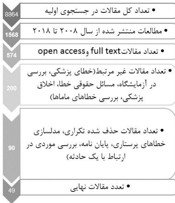
شکل ۱. نحوه انتخاب مقالات در پایگاه های داده

این روش در تمام طول فرایند تجزیه و تحلیل وظایف شغلی، عمده خطاهای خارجی و خطاهایی با مکانیسم روان شناختی را می توان تشخیص داد. در این مطالعه انواع خطا براساس طبقه بندی روش SHERPA مطالعه شده است.