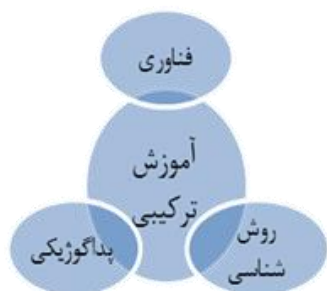
شکل ۱: ابعاد تشکیل دهنده آموزش ترکیبی (۱، ۱۷، ۱۸، ۱۹، ۲۰).