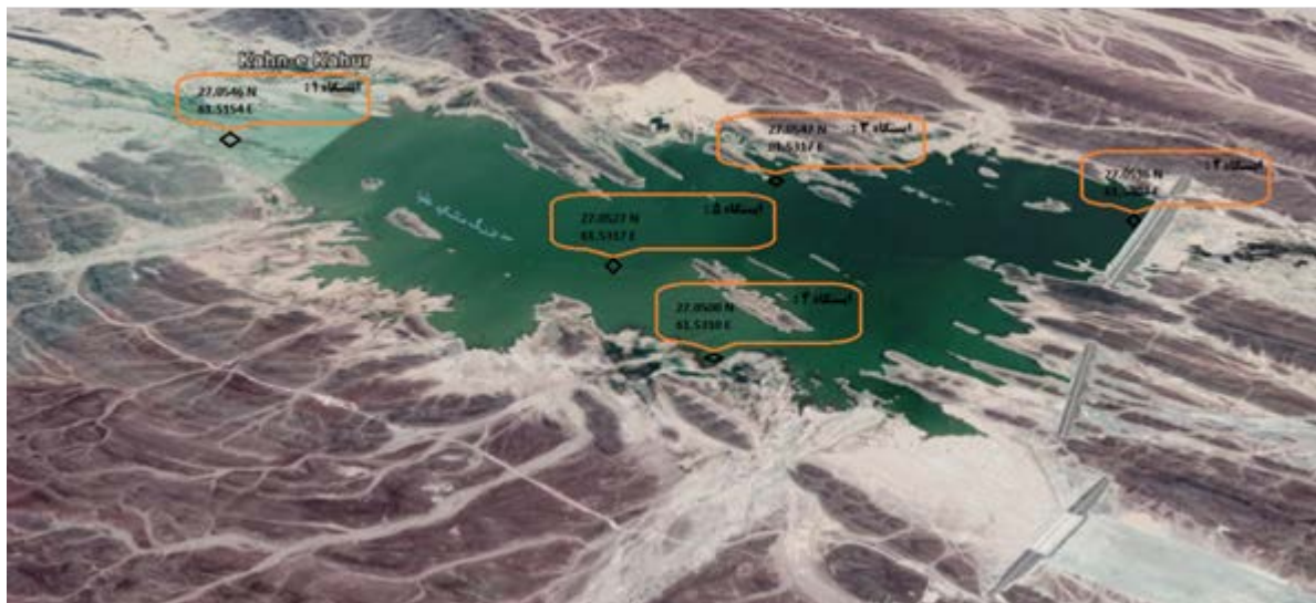
شکل ۱. نقشه هوایی سد ماشکید و موقعیت ایستگاههای نمونه برداری

گردید. برای اندازه‌گیری کلی فرم‌های مدفوعی، نیترات، نیتريت، آمونیوم، میزان سختی کل، پارامتر COD، پارامتر BOD و پارامتر TS از روش‌های آزمایشگاهی استاندارد مطابق کتاب استاندارد متد استفاده شد.