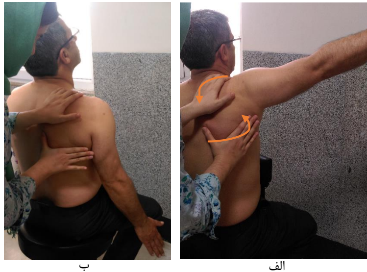
شکل ۴: نحوه انجام آزمون همراهی کتف