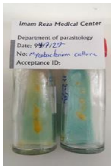
شکل ۸: کلنی‌های مایکوباکتریوم محیط کشت لویشتاین جنسن

احساس درد داشت. همچنین از خارش گاه‌گاه نیز در محل ضایعه حکایت می‌کرد. دوماه قبل از این بیمار با مراجعه به پزشک عمومی درمان با آنتی‌بیوتیک Amoxicillin 500mg را شروع کرده بود اما هیچ تاثیری بر روند درمان بیماری‌اش نداشت. از بیمار نمونه تهیه گردید و اسمیرها به روش گیمسا و زیل نلسون رنگ‌آمیزی گردید. آزمایش از نظر وجود جسم لیشمن منفی اما از نظر وجود باسیل‌های اسید فست مایکوباکتریوم مثبت گزارش شد. از بیمار طی نمونه مجدد کشت میکروبی روی محیط لونشتاین جنسن به عمل آمد که بعد از ۳ هفته کلنی‌های زرد رنگ مایکوباکتریوم ماریوم بر روی آن نمایان شد (شکل ۸). بیمار با داکسی-سایکلین ۱۰۰mg خوراکی یکبار در روز و سیپرو-فلوکساسین ۵۰۰ mg خوراکی دو بار در روز درمان شد و بعد از ۲ ماه ضایعه به طور کامل بهبود یافت.