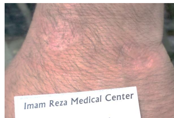
شکل ۶: اسکار پس از بهبودی ضایعه مچ دست بیمار ب