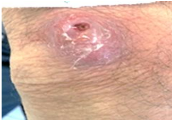
شکل ۳: نمای ضایعه مچ دست بیمار ب