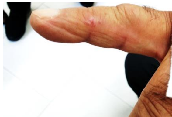
شکل ۴: اشکال وزیکولی اقماری در حاشیه