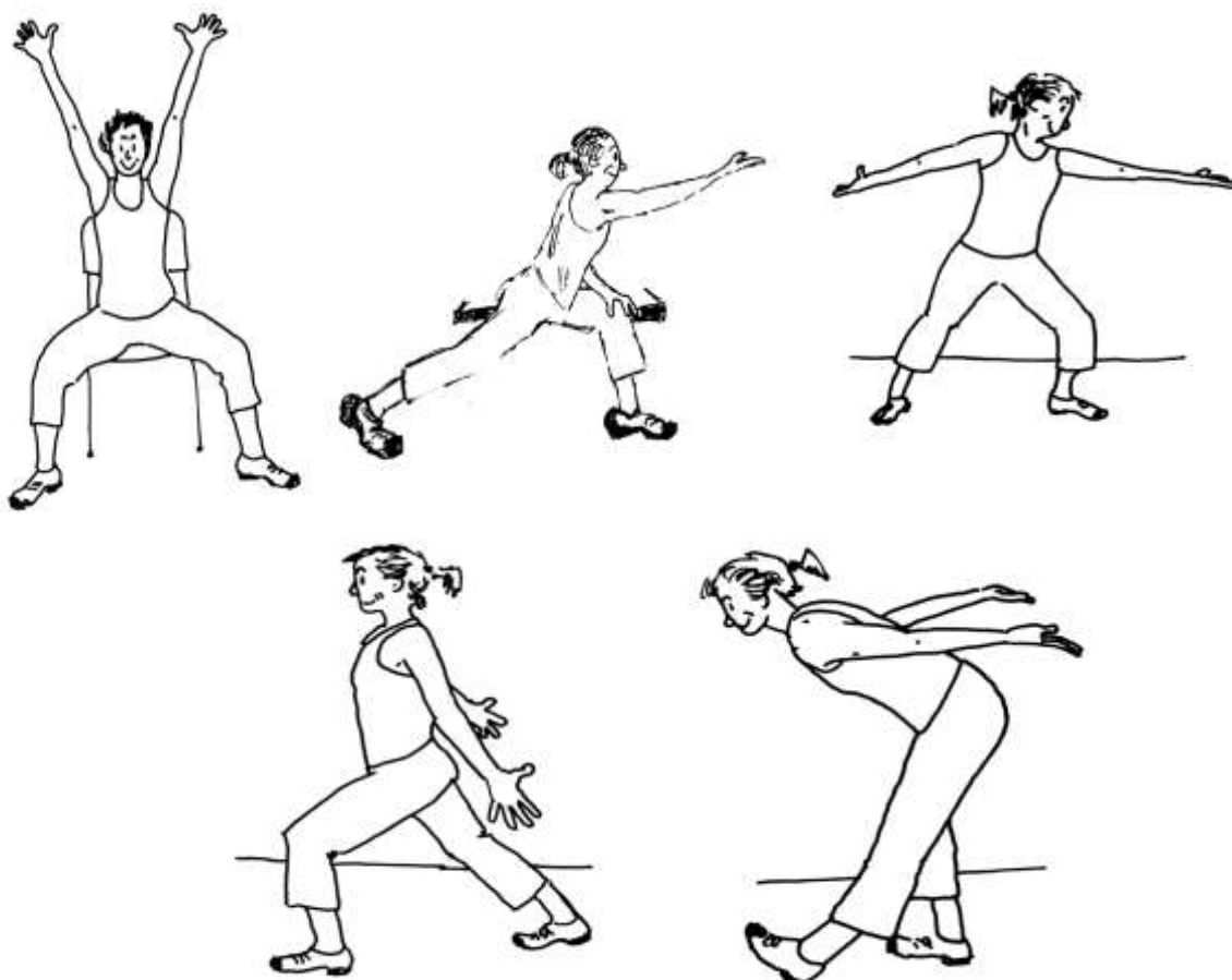
شکل ۳: نمونه چند تمرین در حالت نشسته و ایستاده در روش LSVT-BIG

*** نکته ای که وجود دارد در انجام تمرینات این است که اگر بیمار احساس نکند که حرکت را خیلی بزرگ انجام می دهد آن ها را به اندازه کافی بزرگ انجام نداده است.