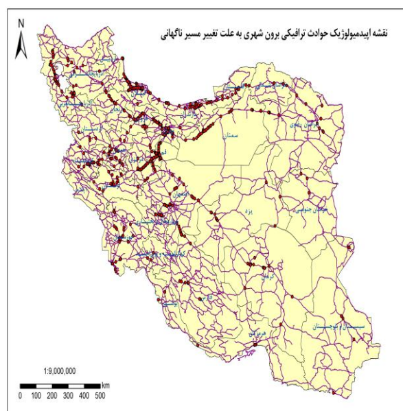
شکل ۳- توزیع مکانی حوادث ترافیکی برون‌شهری به علت تغییر مسیر ناگهانی در سال ۱۳۸۸

در شکل ۳ نیز مشاهده می‌شود که توزیع مکانی عامل خطر تغییر مسیر ناگهانی بیشتر در مسیرهای برون‌شهری شمال ایران پراکنده است. توزیع مکانی عدم توانایی در کنترل وسیله‌نقلیه به عنوان یکی دیگر از عوامل انسانی در نواحی شمال و شمال شرقی کشور مترکم‌تر از سایر نقاط می‌باشد. شمالی نقشه در نواحی شرق و شمال شرق حاکی از وقوع تصادفات کمتر در این نواحی است (شکل ۴). بیشترین فراوانی در بین عوامل مورد بررسی مربوط به عدم توجه به جلو بوده که توزیع مکانی آن بیشتر در غرب و شمال کشور دیده می‌شود. توزیع جغرافیایی عامل خطر به علت حرکت در خلاف جهت در محورهای استان تهران و مختوم به شمال کشور بیشتر خود را نشان می‌دهند.