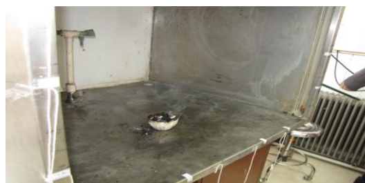
شکل ۲- شکلی از آزمون دود

نتایج آزمون دود: نتایج آزمون دود نشان داد که هود مورد آزمایش در کلیه آزمون‌های دود با حجم زیاد در هر سه سرعت دارای نشتی است زیرا جریان دود به خارج از هود هدایت شده و حتی ممکن است به ناحیه تنفسی اپراتور هود رسیده و منجر به مواجهه وی شود؛ اما در آزمون دود با حجم کم در تمامی سرعت‌ها عملکرد هود قابل پذیرش بود زیرا دود تزریق شده توسط هود به داخل آن کشیده می‌شد. در شکل ۲ تصویری از آزمون انجام شده نشان داده شده است.