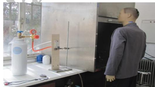
شکل ۱- چیدمان آزمون گاز بی‌اثر براساس روش ASHRAE 110

آزمون گاز بی‌اثر: مهم‌ترین بخش عملی پژوهش، تزریق گاز بی‌اثر در سه گذر حجمی مختلف و اندازه‌گیری میزان مواجهه شغلی یک اپراتور مجازی ایستاده در مقابل هود بود. در کلیه بخش‌های آزمون هود به منظور شبیه‌سازی شرایط واقعی، مطابق با شرایط ذکر شده در استاندارد ASHRAE 110-95 یک مانکن با قد ۱۷۰ سانتی‌متر به گونه‌ای در حد وسط مقابل هود قرار گرفت که بینی آن ۷/۵ سانتی‌متر از پنجره هود فاصله داشته باشد (۶، ۹ و ۱۴) شکل (۲). سپس گاز ردیاب سولفور هگزافلوراید در گذرهای حجمی ۲، ۳ و ۴ لیتر بر دقیقه به هود تزریق و مقدار مواجهه شغلی اپراتور مجازی که در واقع نشان دهنده میزان نشتی گاز ردیاب از هود به شمار می‌رود در مجموع با سه بار تکرار ۲۷ بار با روش قرائت مستقیم اندازه‌گیری شد.