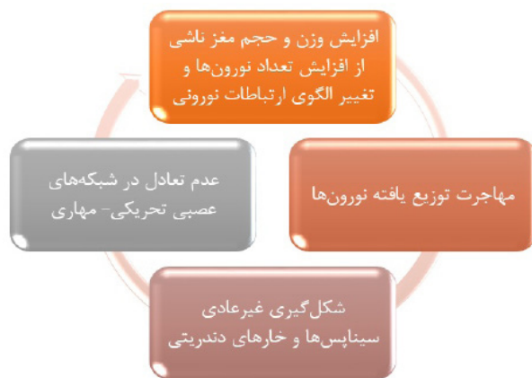
نمودار ۱- فرضیات ساختار مغز مبتلایان به اتیسم.

به نظر می‌رسد اتیسم از عواملی رشدی ناشی می‌شود که بر همه یا بسیاری از سیستم‌های عملکردی مغز اثر گذاشته و روند رشد و تحول مغز را دچار تغییر می‌نمایند. مطالعات نورواناتومیک قویاً حکایت از آن دارد که تغییر یا اختلال در رشد مغز مبتلایان به اتیسم، در هفته‌های اول بارداری شروع می‌شود. ظاهراً این تغییرات رشدی، حوادثی پاتولوژیک در مغز پدید می‌آورند که مغز را به شدت تحت تأثیر عوامل محیطی قرار می‌دهد. با توجه به اینکه اغلب مطالعاتی که پس از مرگ مبتلایان به اتیسم روی مغز آن‌ها صورت گرفته به مواردی مربوط می‌شود که اتیسم با عقب‌ماندگی ذهنی همراه بوده است نتیجه‌گیری قطعی از این مطالعات دشوار است. با آنکه می‌دانیم وزن و حجم مغز کودکان اوتیستیک بیشتر از همتایان سالم ایشان است. ولی اساس سلولی و مولکولی این رشد بیش از اندازه شناخته شده نیست (۵). فرضیاتی در زمینه ساختار مغز مبتلایان به اتیسم مطرح می‌باشد که به طور خلاصه به برخی اشاره می‌نماییم (نمودار ۱).