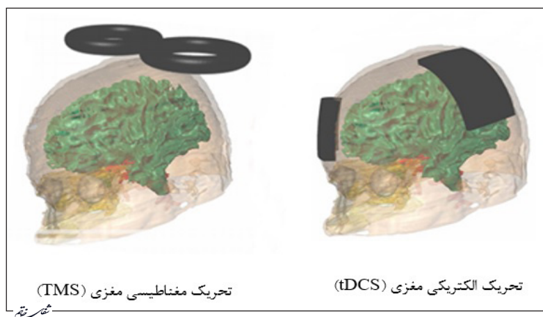
تصویر ۱- تصویر سمت راست تحریک الکتریکی مغزی و تصویر سمت چپ تحریک مغناطیسی مغزی.

در دو دهه گذشته از دو فناوری تحریک مغناطیسی مغزی (rTMS) ۲ و تحریک الکتریکی مغزی (tDCS) ۳ برای درمان اختلالات نورولوژی و روانپزشکی و همچنین برای ارتقاء عملکردهای حرکتی و شناختی استفاده شده است. با وجود کاربردهای شناخته شده این دو روش،