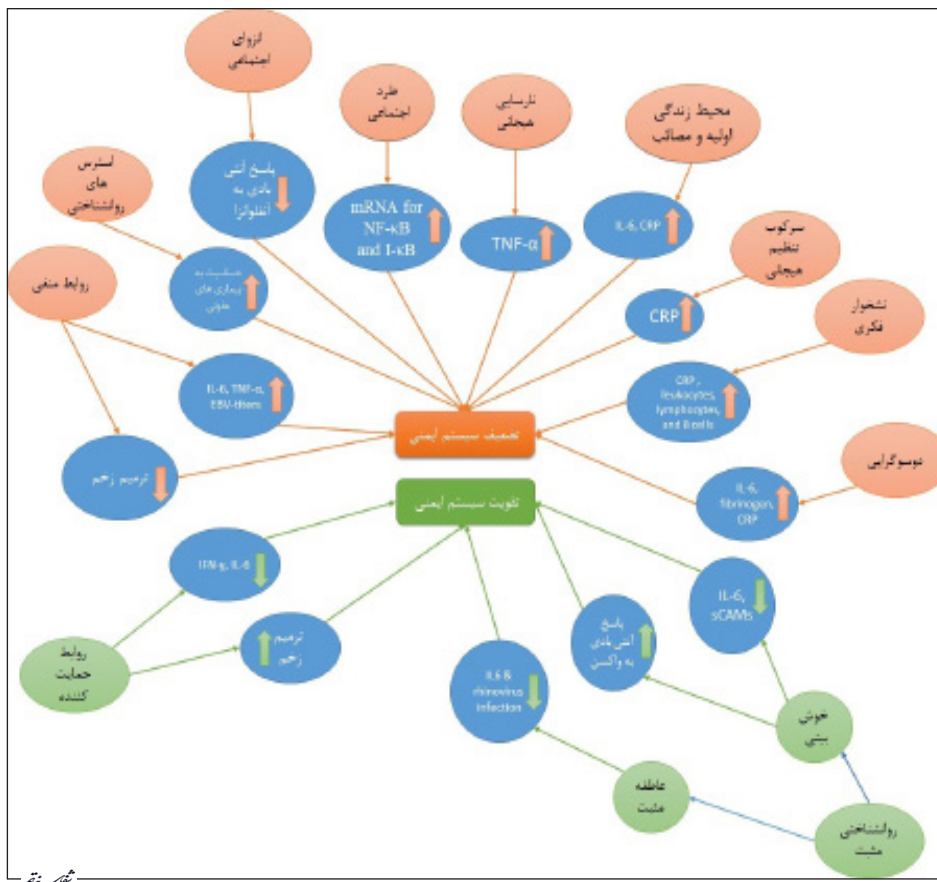
تصویر ۲- تأثیر فرایندهای درون فردی و بین فردی بر سیستم ایمنی. فرایندهای درون فردی و بین فردی عمدتاً با تأثیر بر مکانیسم‌های التهابی می‌توانند منجر به تعدیل بهبود و یا تضعیف سیستم ایمنی شوند.

نشخوار فکری به صورت افکار یا تصاویر آگاهانه، غیر