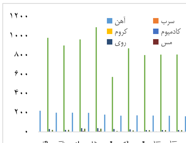
شکل ۳: تغییرات مقادیر فلزات سنگین شیرابه

میانگین غلظت فلزات، منیزیم دارای بیشترین غلظت بوده که به سبب وجود مقادیر بیشتر منابع حاوی این فلز در زباله می-باشد. پس از آن آهن، روی، منگنز، سرب، نیکل، مس، کادمیوم و کروم به ترتیب، بیشترین غلظت را در شیرابه داشتند. مقادیر فلز کروم در ماه‌های مختلف از حد استانداردهای تخلیه فاضلاب سازمان حفاظت محیط‌زیست پایین‌تر است و این نشان‌دهنده پایین بودن میزان منبع این فلز (فرایندهای چرم‌سازی) در پسماندهای شهری است.