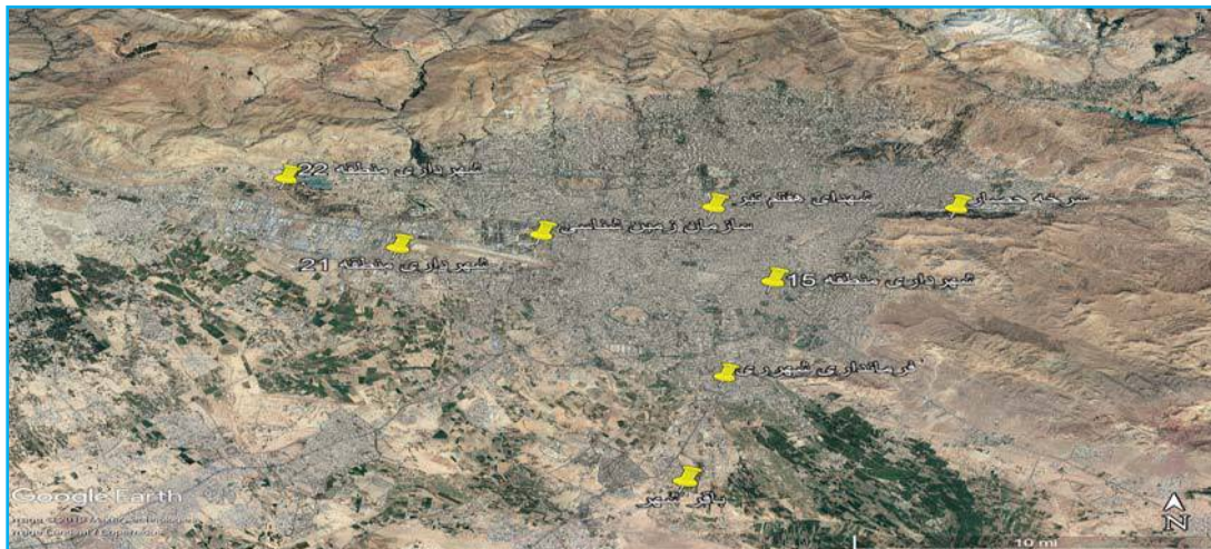
شکل ۱. موقعیت ایستگاه‌های نمونه برداری غبار ترسیب شده اتمسفری

در این مطالعه از نمونه بردار مناسب ترسیب استفاده شد. نمونه برداری ترسیب غبار USGS ۱ (سازمان زمین‌شناسی ایالات متحده) برای اولین بار توسط گوزنس و آفر ارائه شد (۲۴) و کالیبراسیون این نمونه بردار توسط آزمایش تونل باد و کارایی آن مورد تأیید قرار گرفت. به‌طور خلاصه این نمونه بردار از دو بخش ظرف نمونه بردار و تله‌های جمع‌آوری ترسیب تشکیل شده است. در این مطالعه از ظروف فلزونی استفاده شد؛ به‌طوری‌که قطر بالا، پایین و ارتفاع ظرف به ترتیب ۳۰، ۲۲ و ۹ سانتی‌متر بود. تله‌های جمع‌آوری ترسیب در این مطالعه، تله‌های رسوب‌گیر تیله‌ای از جنس شیشه بود که به‌صورت یک یا دو لایه تیله شیشه‌ای در ظروف پلاستیکی قرار داده شد. این ظروف در ارتفاع ۱۰-۲۰ متری ساختمان‌های مدنظر در نقاط نمونه برداری قرار داده شد. هم‌جنس ظرف و هم‌جنس تیله‌ها با آنالیز فلزات سنگین متناسب بود. فرآیندهای پیش‌شرطی جهت آماده‌سازی نمونه بردارها صورت گرفت؛ به‌طوری‌که نمونه بردارها پیش از نمونه برداری با آب مقطر دو بار تقطیر شده شستشو شد. ظروف حاوی تیله‌ها به مدت یک فصل در نقاط نمونه برداری منتخب شامل: شهرداری منطقه ۲۲، شهرداری منطقه ۲۱، سازمان زمین‌شناسی، شهدای هفتم تیر، شهرداری باقرشهر، سرخه‌حصار، فرمانداری