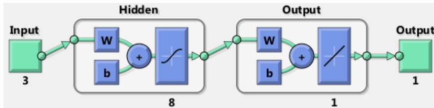
شکل ۲: بهترین معماری شبکه

درک برای انسان از روابط موجود در یک مجموعه داده‌ای هستند و پیش‌بینی خود را در قالب قوانینی که از نظر پارامترهای آماری برازش مناسبی دارند ارائه می‌کنند. این روش یادگیری برای توابع گسسته و داده‌های خطادار به کار می‌رود و به کشف دانش کمک می‌کند [۲۶]. درخت تصمیم یکی از ابزارهای داده‌کاوی در ارتباط با حل مشکلات بیماری‌ها در دنیای واقعی است. درخت تصمیم مجموعه داده‌های دیابت را طبقه‌بندی می‌کند. یک درخت تصمیم‌گیری یک مدل طبقه‌بندی مناسب با استفاده از مجموعه‌ای از داده‌ها می‌باشد [۲۷] ویژگی‌ها از میان مجموعه‌ای از داده‌ها برای کمک به تصمیم‌گیری استخراج می‌شوند. توزیع کلاس به صورت کلاس با مقدار ۱ به معنی ابتلا به دیابت بارداری و کلاس ۰ به معنی دیابت حاملگی منفی می‌باشد. مراحل الگوریتم درخت تصمیم‌گیری به شرح زیر است: پس از وارد کردن ورودی‌ها از مجموعه داده‌ها، برای هر ویژگی اطلاعات حاصل از تقسیم بر روی آن ویژگی را نمایش داده و بهترین را از میان صفات پیدا می‌نماید. در نتیجه انتخاب گره تصمیم‌گیری و تقسیم بر روی بهترین ویژگی انجام می‌شود. پس از انتخاب نود تصمیم‌گیری یک الگوریتم بازگشتی بر روی زیر شاخه‌ها و تقسیم شدن شاخه‌ها در بهترین ویژگی انجام شده و آن گره به عنوان گره فرزند به درخت اضافه می‌شود [۲۴]. در این مقاله، از الگوریتم درخت تصمیم C4.5 برای داده‌کاوی استفاده شده است. داده‌کاوی هسته مرکزی فرآیند کشف دانش از پایگاه داده KDD (Knowledge Discovery in Database) می‌باشد که به پیدا کردن الگوها و قواعد از بین پایگاه داده‌های بزرگ کمک می‌کند [۲۸]. درخت تصمیم قوانین تصمیم‌گیری و