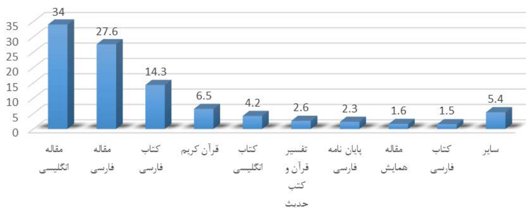
نمودار ۲: توزیع فراوانی مقالات منتشر شده بر اساس نوع منابع اطلاعاتی در مجله دین و سلامت از سال ۱۳۹۲ تا ۱۳۹۶