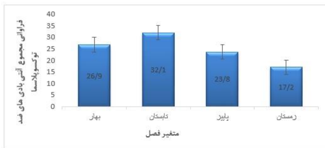
شکل ۱- فراوانی شیوع سرمی آنتی‌بادی ضد توکسوپلازما (OD450nm) بر حسب متغیر فصل

نتایج آزمون آماری تفاوت معنی‌داری را بین افراد IgM مثبت و IgG مثبت در جمعیت روستایی و شهری نشان نداد ( P = ۰/۰۵۴ و P = ۴/۷۳۵ ). بر این اساس شیوع سرمی آنتی‌بادی‌های ضد توکسوپلازما گوندی بین زنان و مردان در جمعیت