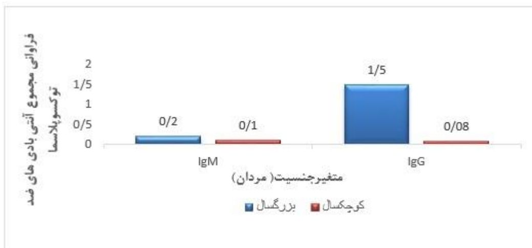
شکل ۲- درصد فراوانی آنتی‌بادی‌های IgM و IgG ضد توکسوپلاسم (OD450nm) بر حسب متغیر جنسیت و سن (مردان)