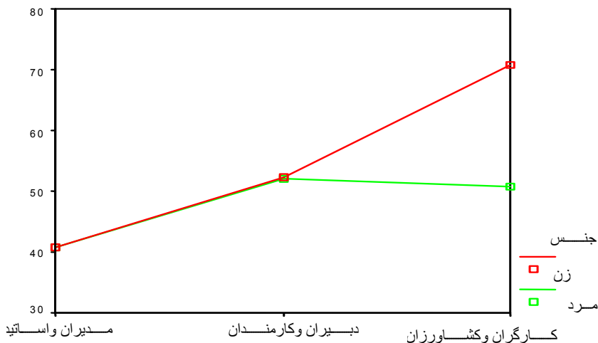
نمودار ۱. اثر تعاملی جنس و شغل بر درماندگی روانی

در مورد متغیر هوش هیجانی تفاوت هر سه گروه با هم معنادار است. به این صورت که هوش هیجانی مدیران و اساتید دانشگاه بالاتر از کارمندان و دبیران؛ و هوش هیجانی کارمندان و دبیران بالاتر از کارگران و کشاورزان است. در زمینه سلامت جسمی ذهنی تفاوت بین مدیران و اساتید دانشگاه با هر دو گروه کارگران و کشاورزان؛ و کارمندان و دبیران معنادار است، اما در زمینه سلامت جسمی عینی فقط تفاوت بین مدیران و اساتید دانشگاه با گروه کارگران و کشاورزان معنادار است. اثر تعاملی شغل و جنس بر درماندگی روانی (نمودار ۱) نشان می دهد میانگین نمرات درماندگی روانی دو جنس در دو گروه مدیران و اساتید دانشگاه و کارمندان و دبیران یکسان است، اما نمرات مذکور در زنان کارگر و کشاورز بالاتر از مردان است. در زمینه اثر تعاملی شغل و جنس بر هوش هیجانی (نمودار ۲)، میانگین نمرات مردان به طور معناداری بالاتر از میانگین نمرات زنان در گروه کارگران و کشاورزان است.